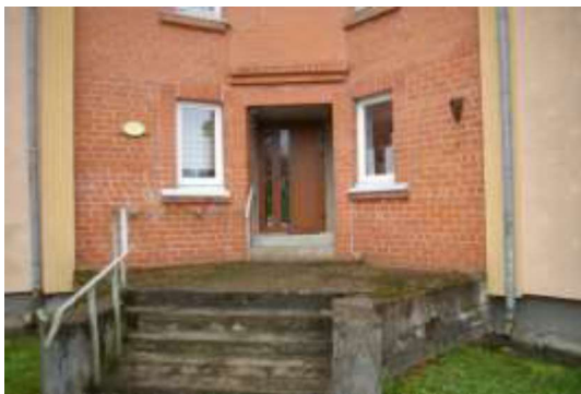
Būve ar kadastra apzīmējumu 6415 007 0010 005