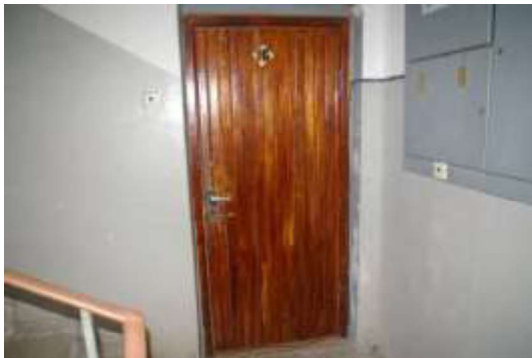
Būve ar kadastra apzīmējumu 6415 007 0010 005, dzīvoklis Nr.16