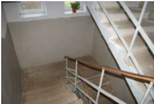
Būve ar kadastra apzīmējumu 6415 007 0010 005, koplietošanas telpa